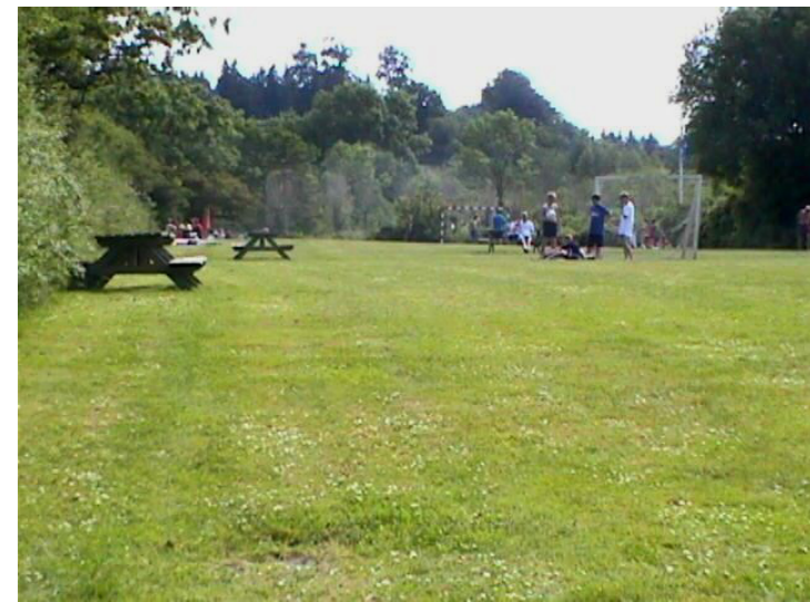
Grønt område ved Kongshøj Strand

På hele strækningen langs kysten bør der ske en bekæmpelse af den farlige plante bjørneklo.