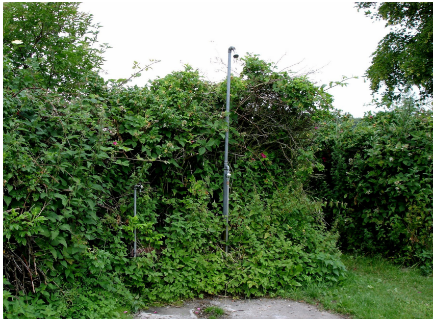
Bruseren ved Kongshøj Strand