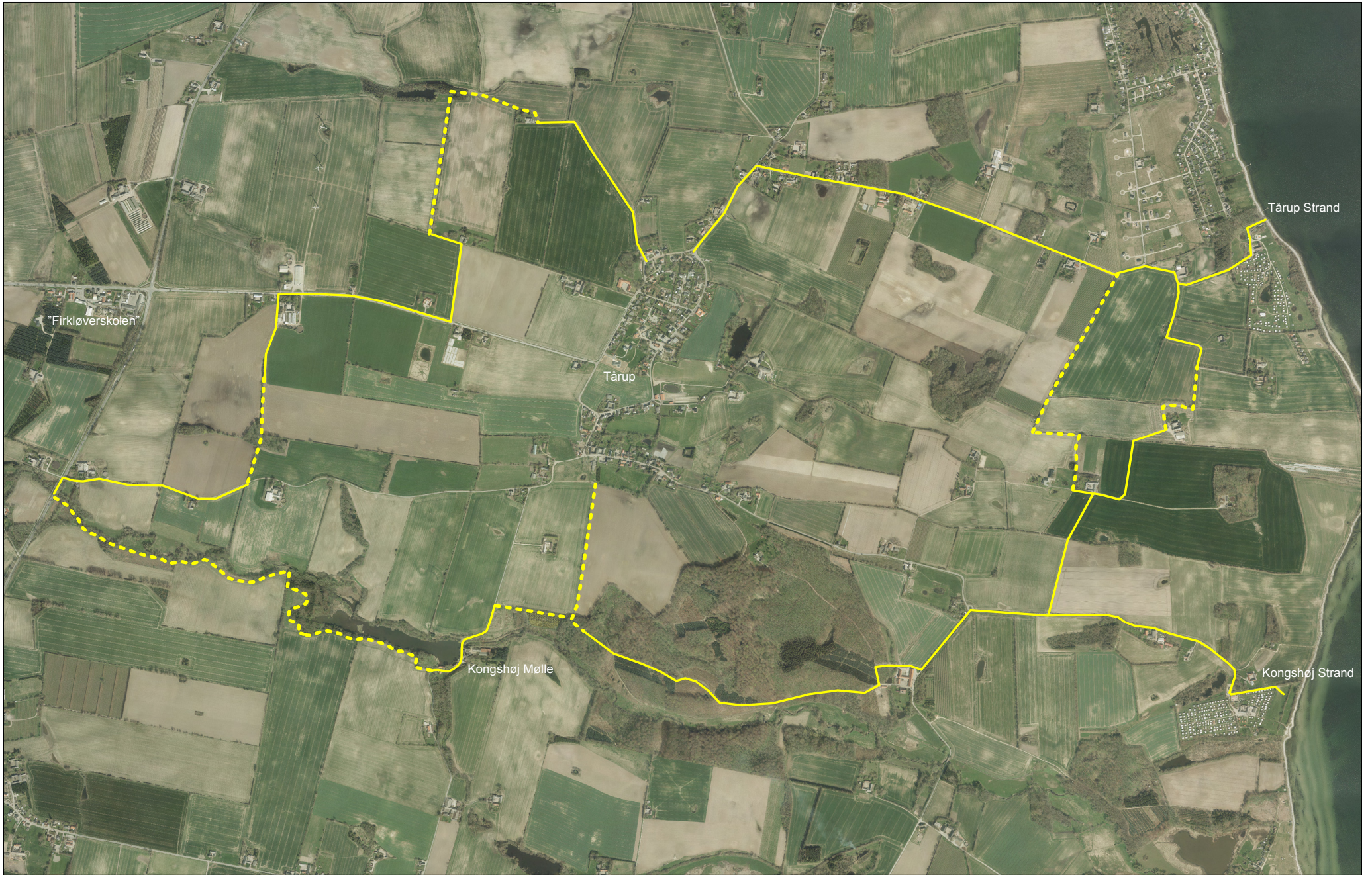
Gåture omkring Tårup og kysten