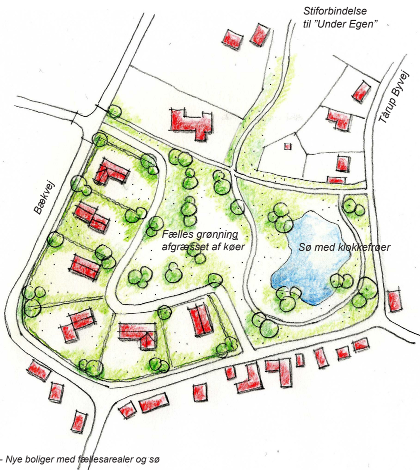
Bækvej Syd - Nye boliger med fællesarealer og sø

Der er ca. 2 km til landevejen Nyborg-Svendborg, og "Firkløverskolen" (tidligere Frørup Skole) ligger kun 2 km fra Tårup. For børnefamilier, der ønsker at flytte på landet med frisk luft, natur, skov og strand, vil Tårup være en god mulighed, - en landsby hvor sammenhold og fællesskab vægtes højt.