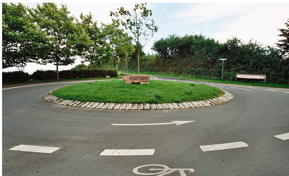
Rundkørslen ved Kongshøj

Der er på dette tidspunkt ingen bebyggelse langs den nord-sydgående vej vest for bygaden, - Bækvej. Denne vej er sandsynligvis yngre end bygaden.