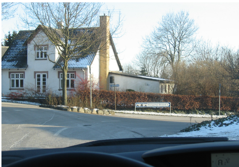
Her mangler et vejskilt til "Forsamlingshuset"

af linieføringen af Bækvej mellem Skoleallé og Grubbens Allé for at bedre oversigtsforholdene på strækningen. Samtidig ønsker vi, at cykel- og gangstien langs Bækvej, der nu slutter ved Grubbens Allé, føres frem til Skoleallé.